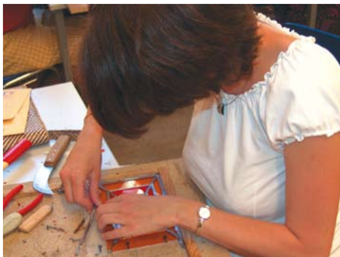
Atelier de création de vitraux à la M.C.L.

P articipant au développement des pratiques culturelles et artistiques depuis plus de soixante ans, la Maison de la Culture et des Loisirs de Metz propose une offre conséquente d'activités. Accessibles à tout âge et à tous niveaux, elles sont réparties en cinq pôles : les arts visuels (art floral, photographie, vitrail au plomb...), les langues vivantes (arabe littéraire, chinois, japonais...), les loisirs et techniques (aquariophilie, informatique,...), les musiques actuelles (batterie, piano, éveil musical...), les arts dramatiques et l'expression corporelle (café théâtre, danse, relaxation...). Depuis 2003, l'établissement propose aux plus jeunes un accueil sur mesure au sein du secteur Enfance et Jeunesse. Ils ont ainsi la possibilité de découvrir des expositions avec leur école, ou de participer à des stages à vocations artistiques durant les vacances scolaires. Accompagnés par des intervenants spécialisés, les jeunes de 8 à 16 ans pourront s'initier à l'animation vidéo et aux effets spéciaux du cinéma du 18 au 22 février.