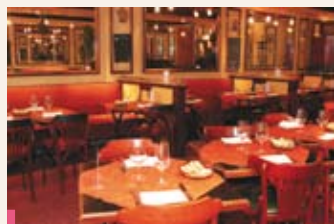
Le Bistrot de la Gare