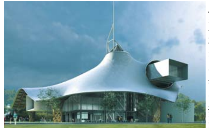
© CazM/Shigeru Ban Architects Europe & Jean de Gaslines / Artefactory

A près un nettoyage des voûtes en granit et des carrelages en faïence, le passage de l'Amphithéâtre a retrouvé une seconde jeunesse et marque le lien entre le Quartier Impérial et celui de l'Amphithéâtre. Pour célébrer ce renouveau, dix vitrines rétroéclairées de 4 mètres sur 3 ont été installées. Elles accueillent depuis quelques jours des affiches aux couleurs des lieux culturels messins : Bougez aux Arènes, Sortez à Metz en Fête, Swinguez aux Trinitaires ou encore Vibrez à l'Arsenal, tels sont les messages que l'on peut lire avant la prochaine installation de vues présentant les étapes du chantier du Centre Pompidou-Metz. De nouveaux clichés du projet seront ainsi dévoilés au public.