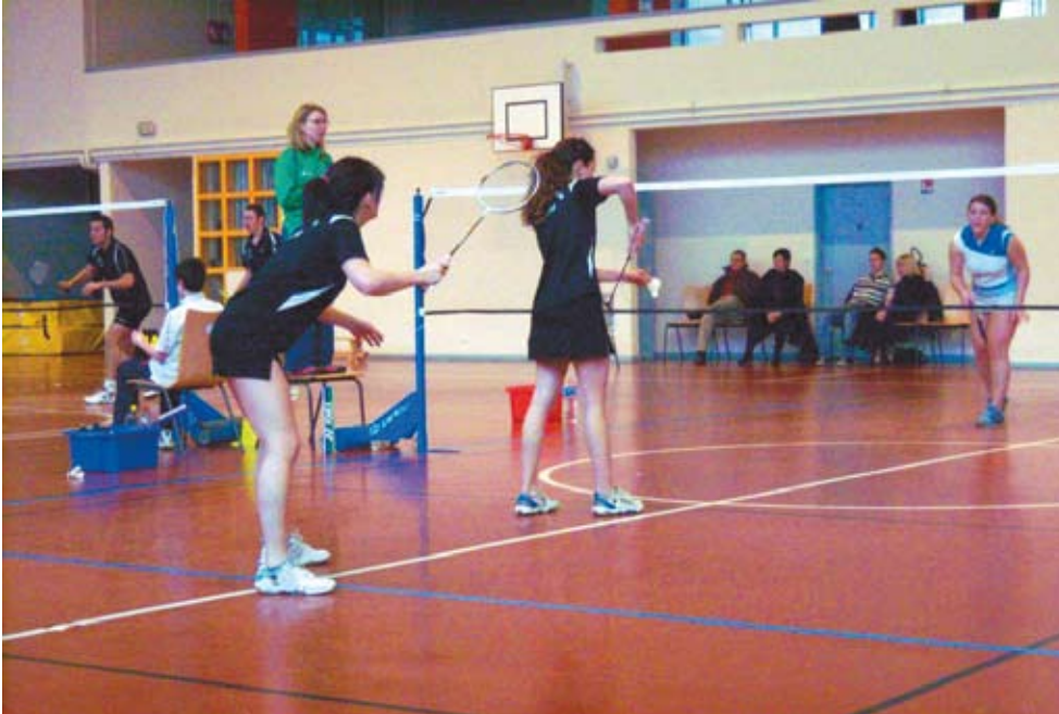
Championnat de France Interclubs nationale 3.

Depuis 20 ans, le SMEC Badminton de Metz s'attache à faire découvrir aux Messins un sport à la fois intense, jeu d'adresse et de détente.