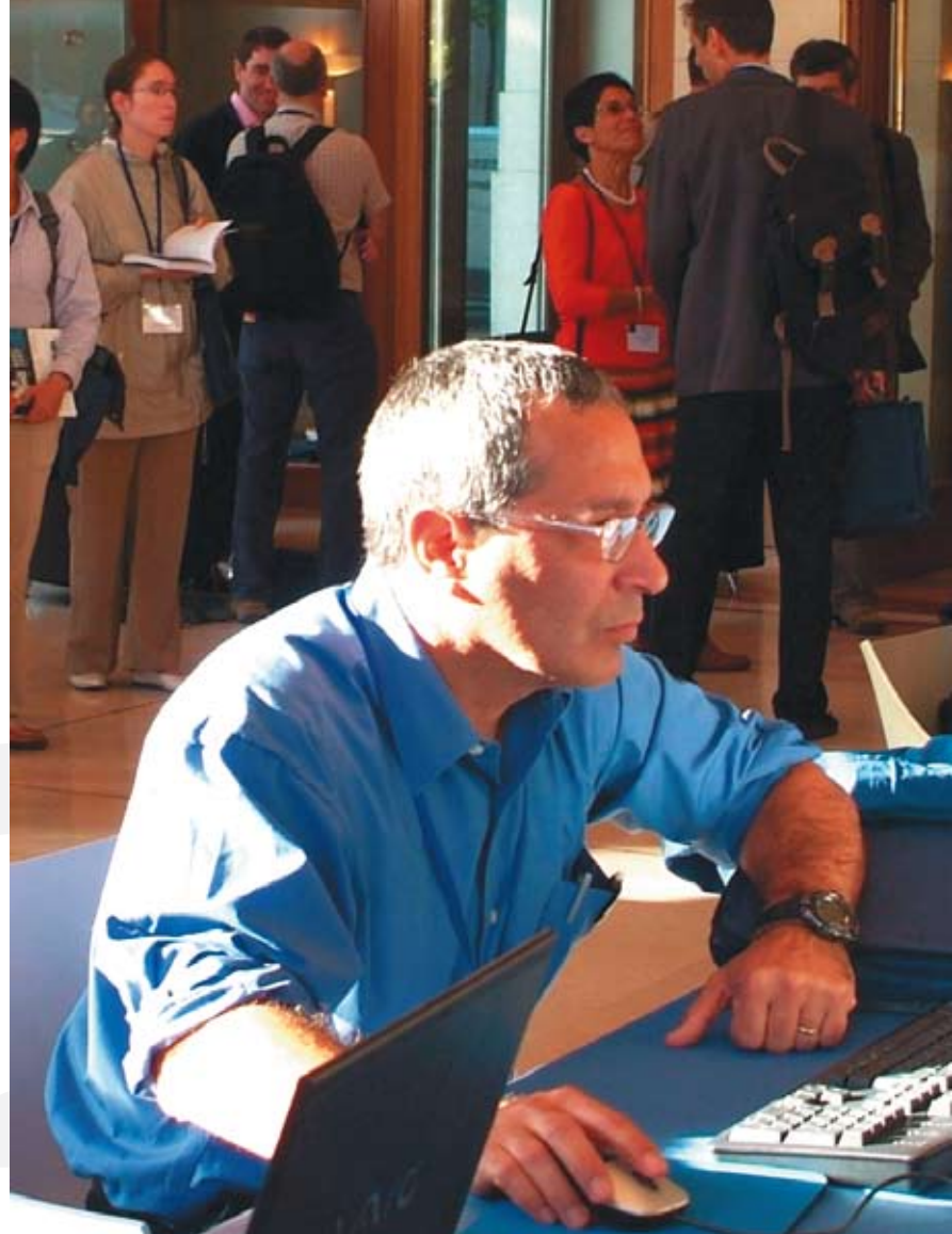
La connexion Wifi est accessible dans les principaux lieux publics et places Messines.

LES INTERNAUTES MESSINS POURRONT BÉNÉFICIER CETTE ANNÉE DU TRÈS HAUT DÉBIT À LEUR DOMICILE